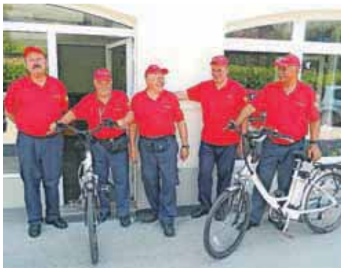
Električna kolesa so na prvi vožnji preizkusili veterani domačega gasilskega društva.

drugimi potmi v Preddvoru. Hvala vsem lastnikom zemljišč, ki so zanje dali soglasja, poudarja Kramp Ni-