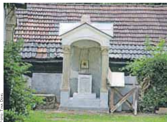
Na pokopališču obnavljajo grobnico rodbine Urbančič.