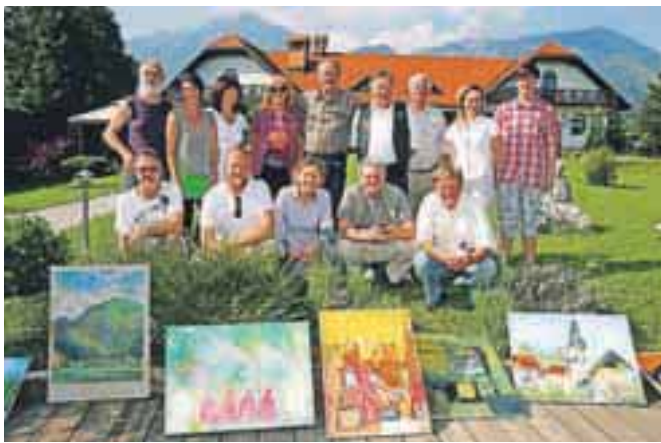
Udeleženci tretjega mednarodnega srečanja Ex tempore Preddvor