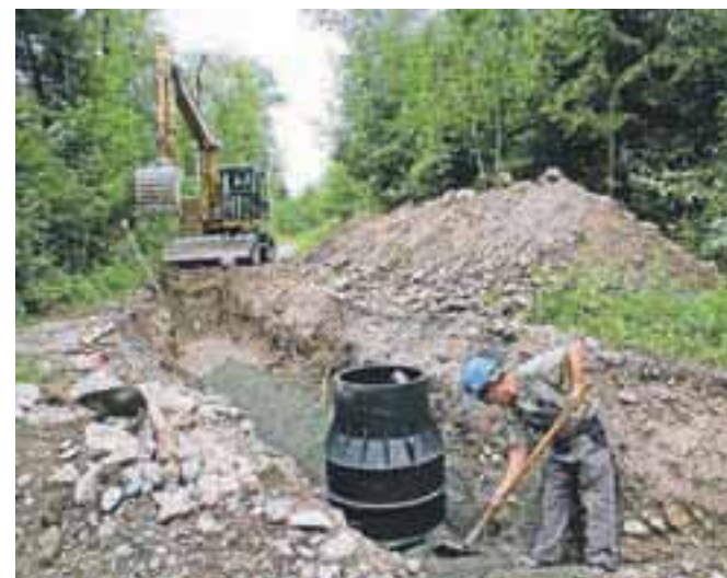
Kanalizacijo že gradijo, čistilno napravo bodo, ko bo končan postopek izbire izvajalca.