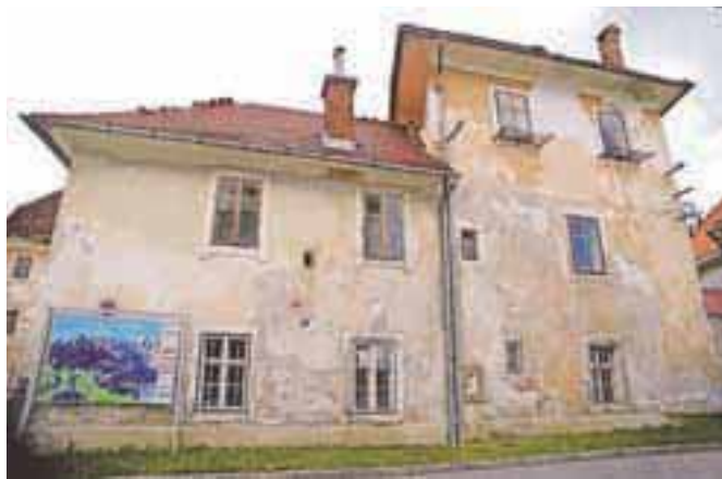
Propadajoči grad Dvor sredi Preddvora