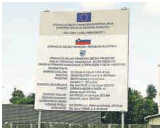
Tabla, ki v Preddvoru označuje gradnjo kanalizacije in čistilne naprave

del za celotno operacijo 2,1 milijona evrov brez DDV, vendar zaradi razmer na trgu gradbeništva kaže, da bomo projekt oddali izvajalcem za malo manj kot 1,7 milijona. Od tega je Občini Preddvor uspelo pridobiti 566.591 evrov iz Evropskega sklada ter 318.154 evrov iz državnega proračuna po 21. členu zakona o financiranju občin. Projekt bo potekal v dveh proračunskih letih, končan mora biti do septembra 2014.