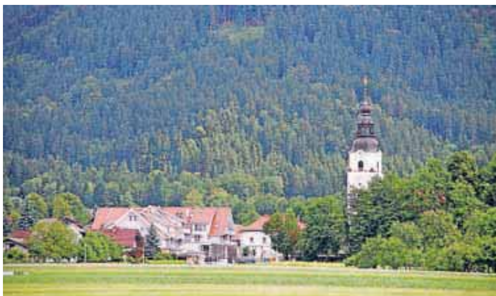
Preddvor z okolico je navdihnil številne glasbenike.

Preddvor – Praznik je posvečen prvi slovenski pesnici, pisateljici in skladateljici Josipini Urbančič Turnograjski, rojeni 9. julija 1833 na gradu Turn (umrla 1854 v Gradcu). Letos je torej natančno 180 let od njenega rojstva. Letošnje praznovanje bodo v Preddvoru začeli že v petek, 5. julija, s praznično mašo v cerkvi sv. Petra, nadaljevali v soboto z odprtjem razstave ročnih del skupine Gelike, ki se ukvarjajo z ročnimi deli pri Društvu upokojenecv Preddvor, v Info centru, s pohodom po gradovih, nato pa sledi celodnevna nedeljska prireditev 7. julija. Tradicionalni Petrov s mn, ki ga pripravlja domače turistično društvo, se bo tega dne nadaljevalo s prireditvijo Melodije Preddvora ob izidu zgoščenke s pesmimi posvečenimi Preddvoru in okoliškimi hribom.