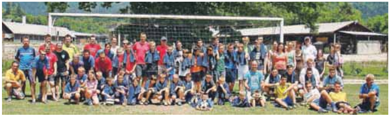
Skupinski posnetek s starši