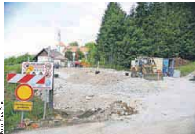
Do jeseni končana dela na cesti proti domu starejših?

Dom starejših občanov Preddvor že nekaj časa energetsko obnavljajo, ob tem pa so izrazili tudi željo, da se naredijo parkirišča ob občinski cesti, ki od križišča v Potočah vodi proti domu. »Odločili smo se za skupno naložbo, za obnovo ceste, pločnika in javne razsvetljave, menjavo vodovodnega sistema in meteorne kanalizacije na tem območju. Skupna vrednost je 380 tisoč evrov, od tega delež občine 120 tisoč evrov. Upam, da bodo do septembra dela končana,« je povedal župan občine Preddvor Miran Zadnikar. D. Ž.